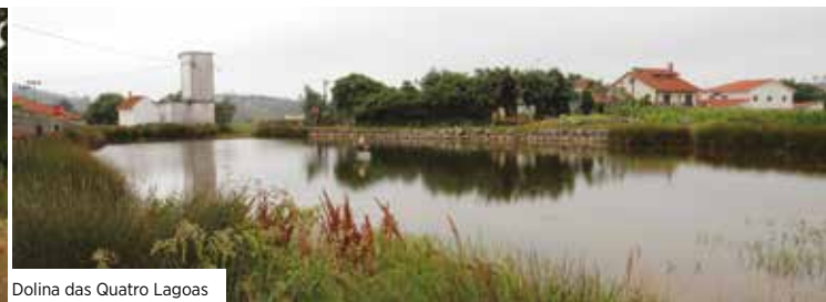
Dolina das Quatro Lagoas