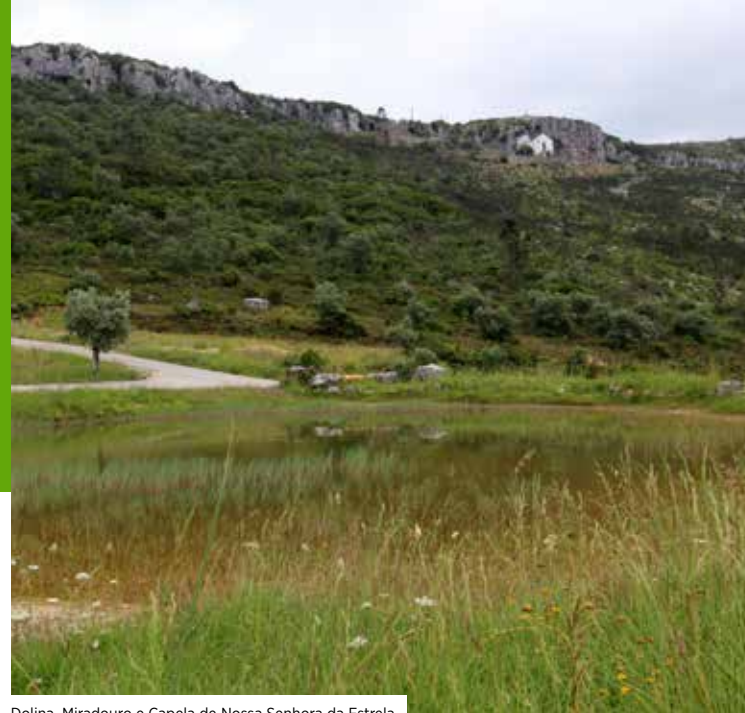
Dolina, Miradouro e Capela de Nossa Senhora da Estrela

Para a realização desta rota circular, com 23,5 km, sugere-se começar no largo da Igreja Matriz de Degracias (S. Sebastião), onde se pode apreciar o edifício religioso datado do séc. XVIII, que guarda no seu interior uma capela batismal dos finais do séc. XVI, inícios do séc. XVII. De salientar ainda o relógio de sol na parede sul da torre sineira. Seguidamente, entra-se no mundo das Dolinas, começando na Dolina das Degracias (dolina em forma de concha, com cerca de 47 m de diâmetro), segue-se em direção à Dolina das Quatro Lagoas (a maior dolina do conjunto de 3 existentes nesta localidade, com uma extensão a oscilar entre os 30 m e os 50 m), à Dolina do Vale Centeio (com uma dimensão entre os 23 m e os 33 metros), passando depois à Dolina de Cotas (de forma circular, com cerca de 28 m de diâmetro).