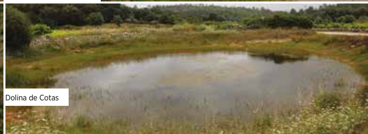
Dolina de Cotas