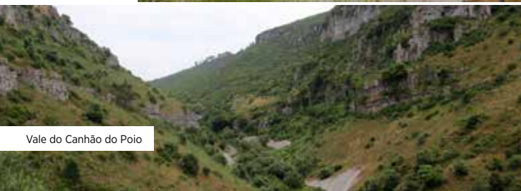
Vale do Canhão do Poio