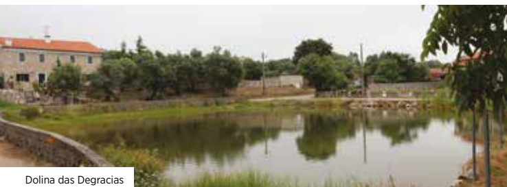
Dolina das Degracias

Devido à grande dimensão da rota, existe uma variante no percurso, corte norte-sul, passando pelo Outeiro do Moinho, que o divide praticamente em dois, criando, assim, a possibilidade de realizar esta rota em dois percursos circulares mais pequenos. Um de 17 km de extensão que segue apenas pelo lado direito da derivação e um segundo de 19 km que segue pelo lado esquerdo.