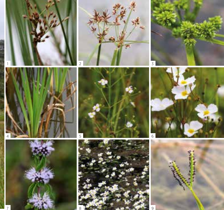
Flora 1 Juncos-solto Juncus effusus 2 Junça Cyperus longus 3 Junção Cyperus eragrostis 4 Tabúia Typha latifolia 5 Tanchagem-da-água Alisma lanceolatum 6 Baldélia-ranunculada Baldellia ranunculoides 7 Poejo Mentha pulegium 8 Ranúnculos-aquáticos Ranunculus peltatus 9 Gramão Cynodon dactylon

Continuando, segue-se ao encontro do vale do Canhão do Poio (canhão fluvio-cársico, com vertentes escarpadas) que guiará até à Dolina da N. Sra. da Estrela (em forma de concha, com cerca de 25 m de diâmetro). O caminho segue até ao Miradouro de Nossa Senhora da Estrela, no alto da Serra dos Poios, local para retemperar forças e apreciar todo o vale do Anços e as serranias do concelho.