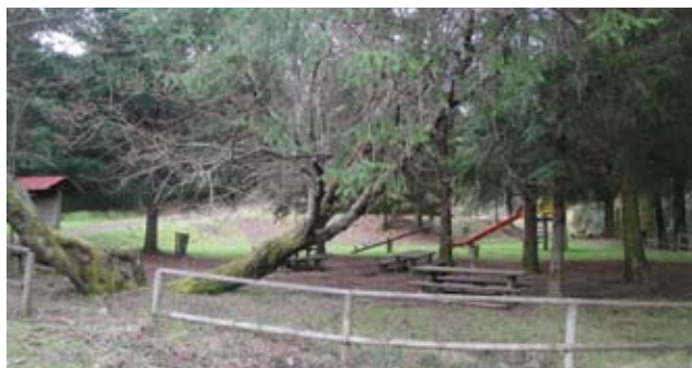
Parque Florestal da Oitava