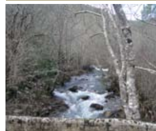
Linha de Água