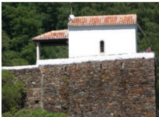
Capela Nossa Senhora da Piedade