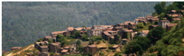
Aldeia do Xisto do Talasnal

Cabrito Chanfana Serrabulho Serranitos Mel DOP Serra da Lousã Migas Talasnicos