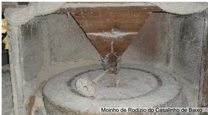
Moinho de Rodízio do Casalinho de Baixo