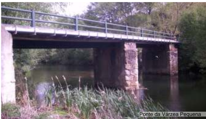
Ponte da Várzea Pequena