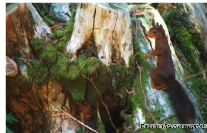
Esquilo ( Sciurus vulgaris )

No rio que acompanha este trilho, predominam três espécies de peixe: a truta-fario ( salmo fario ), o barbo ( barbus bocagei ) e a boga ( chondrostoma polylepis steindachner ). Fora de água, poderá ver vestígios de javali, esquilo e quem sabe poderá ver uma raposa.