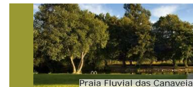
Praia Fluvial das Canaveias