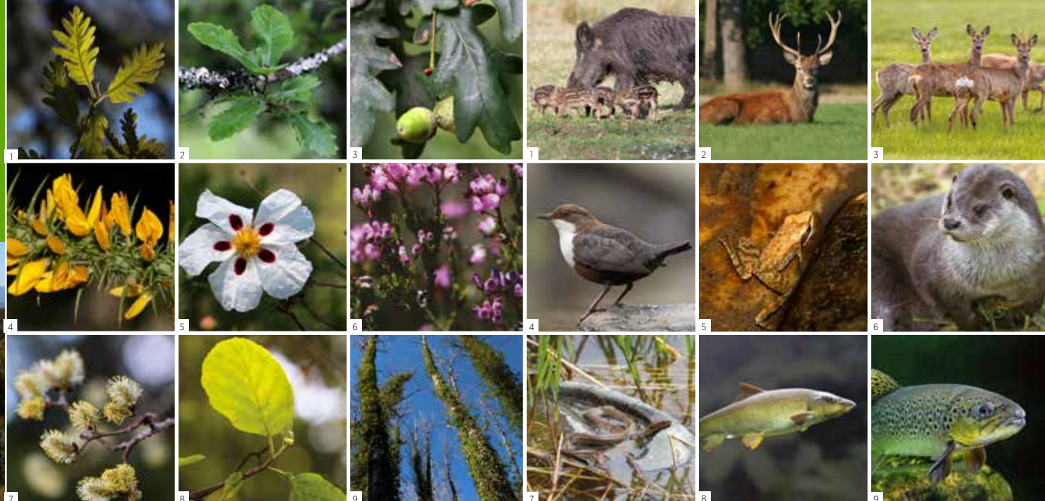
Flora 1 Carvalho-negral Quercus pyrenaica 2 Carvalho-cerquinho Quercus faginea 3 Carvalho-alvarinho Quercus robur 4 Tojo-arnal Ulex europaeus 5 Esteva Cistus ladanifer 6 Urze Erica umbellata 7 Salgueiro-preto Salix atrocinerea 8 Amieiro Alnus glutinosa 9 Choupo-negro Populus nigra