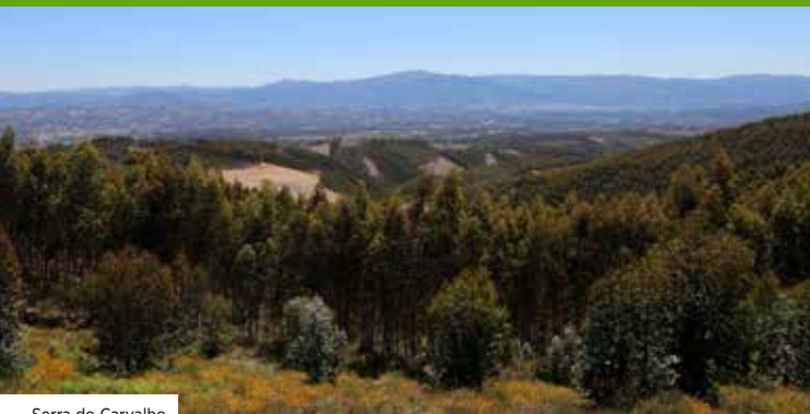
Serra do Carvalho

O percurso da Serra do Carvalho insere-se no projeto transversal “Serras de Coimbra”, da CIM-RC, ligando o Louredo Natura Parque (na povoação de Louredo, junto ao rio Mondego) ao Monumento aos Aviadores, na Serra do Carvalho.